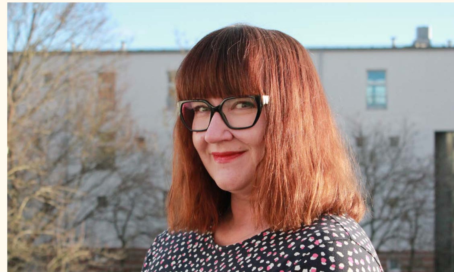
Käännös: Jessica Vikfors