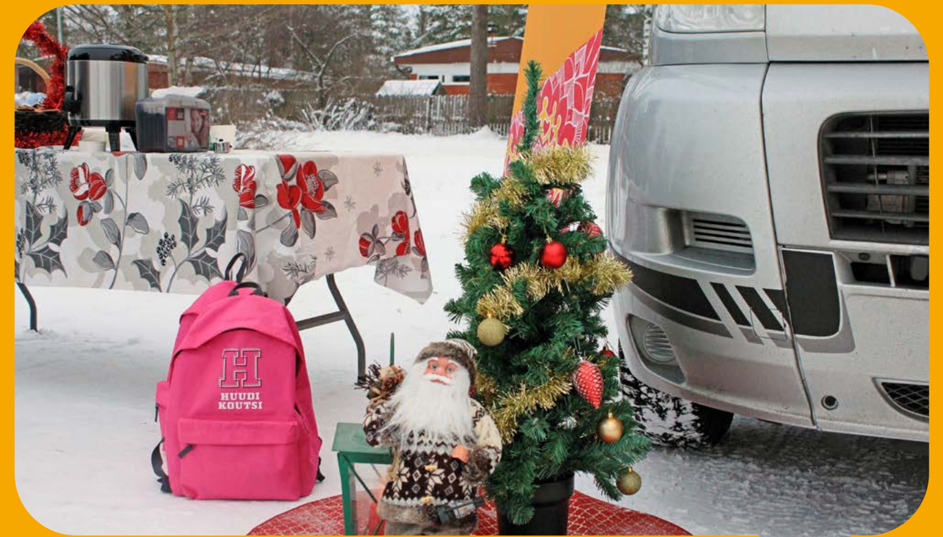
Kylmässä tarjolla oli muun muassa glögiä.